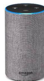
<Amazon Echo イメージ>

今回のワークショップは、島田市としても初の試みではありましたが、参加者から好評を得ることができ、大盛況のうちに終わることができました。また、本年 8 月 29 日にも、静岡県立島田商業高等学校にて同ワークショップが予定されています。